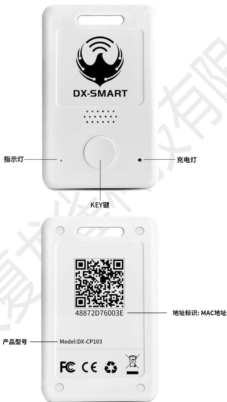
图 1: CP103 产品示意图